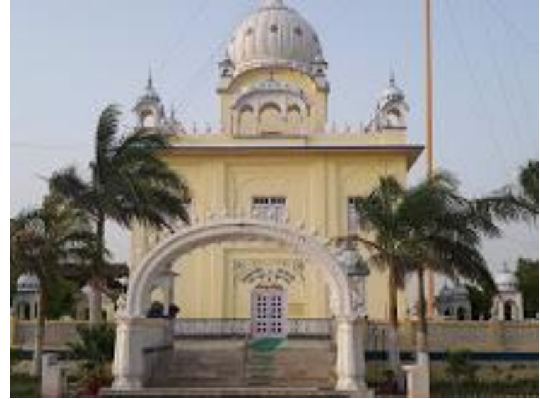
ਗੁਰਦੁਆਰਾ ਪੁਆਂ ਕਲਾਂ, ਟੋਂਕ ਡਿਸਟ੍ਰਿਕਟ, ਰਾਜਸਥਾਨ