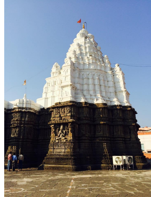
ਔਂਧਾ ਨਾਗਨਾਥ ਮੰਦਰ